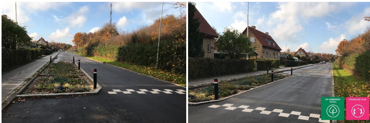
Eksempler på vejbede

Et vejbed er et bed, som etableres på vejen. Vejbedet medvirker til, at vandet forsinkes samtidig med, at bilernes hastighed sænkes. På den måde opnår vi fredeligere vejstrækninger i Åbyhøj, og samtidig planter vi træer eller forskellige blomster, så der bliver mere grønt.